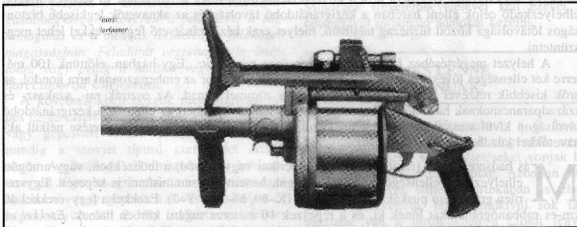
Az MGL-6 hatlövetű gránátpuska, felhajtható válltámasszal

gránátos, a felderítő és az erődalegységeket is sújta. A problémát az alegységparancsnok mellett a szövetségi hadsereg felső vezetése is felismerte. Ezt jelzi Hans Widhofner ezredesnek, a gyalogság felügyelőjének cikke is, mely a Truppendienst 1987/6. számában jelent meg Tűzhézag gyalogsági fegyverzetünkben címmel. A magasabb beosztású parancsnokok már évek óta elkerülhetetlennek tartják egy ilyen fegyver rendszeresítését. Ausztriában napjainkban senki sem gondol a védelmi kiadások növelésére. Ugyanakkor ezek a fegyverek nem túl drágák, rendszeresítésük szükségessége mindenki előtt világos, aki a kérdéssel már foglalkozott, illetve kísérleteket végzett különböző típusú eszközökkel, lőszerrel.